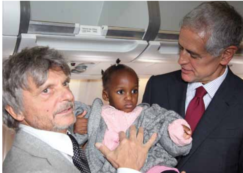
Massimo Ferrero with the President of the Lombardy region, Roberto Formigoni on an humanitarian flight Livingston from Haiti