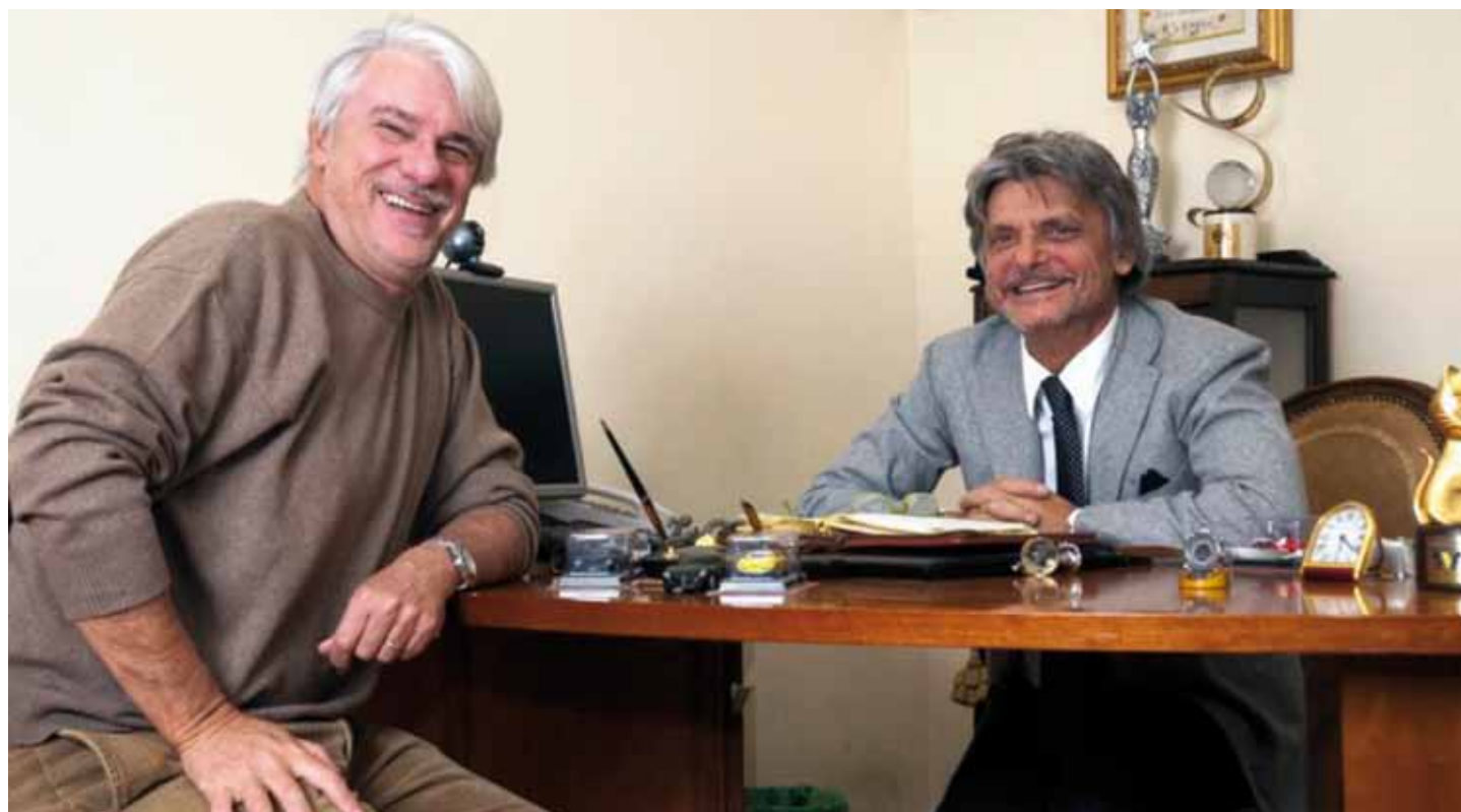
Massimo Ferrero with his friend Ricky Tognazzi