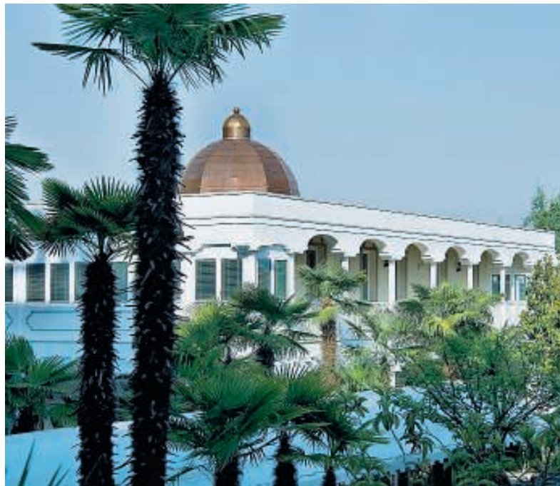
Abano L'Oriente sbarca tra le colline venete, affiancando termalismo e ayurveda.

Dove dormire: Hotel Terme Metropole, telefono 049.8619100. e-mail: metropole.gbhotels.it . sito: www.gbhotels.it